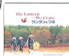
子供の絵本 「ランタンとつる」