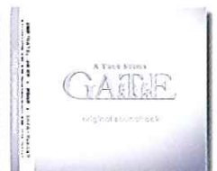
オリジナル サウンドトラック